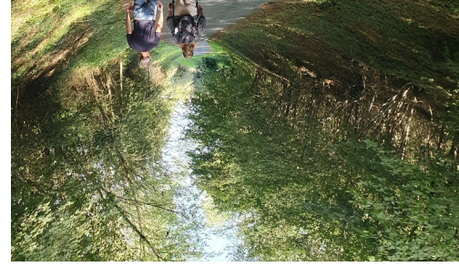
Sentier de randonnée