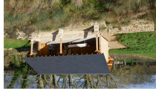
Lavoir de Montépin